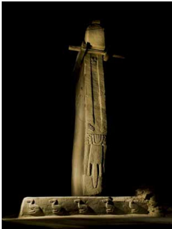
Göbekli Tepe'de bulunan stilize insan figürlü "T" biçimli dikme

theogoniyaların hemen tümünde karşımıza çıkar. Örneğin Mısır'ın Nu/Nun olarak isimlendirilen girdaplı sularından (khaos) doğmuş Heliopolisli yaratıcı Güneş Tanrı Atum bu bağlamda incelemeye değer; çünkü o aynı zamanda "Büyük Erdişi" olarak da isimlendirilir. Bu eril görüntülü tanrı Atum kendi kendini tatmin yoluyla Shu - Hava/Rüzgar ile Tefnut'u - Nem/Isıklık yaratır ve onları tükürerek içinden çıkarır. Theogoniyalarda bezer parthenogenesislere sıklıkla rastlanır; örneğin MÖ 8. yüzyılın sonuna ait Hesiodos'un Theogonias'ında Khaos kendinden Nyks ve Erebus adlı iki karanlığı yaratır; Gaiada Uranos'u, dağları ve Pontos'u bu yolla doğurur.