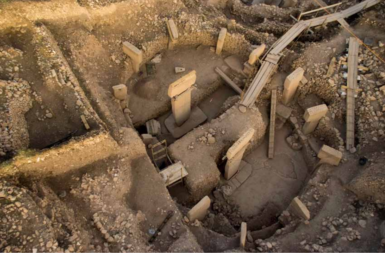
Göbekli Tepe'de "T" biçimli dikmelerden oluşan dairesel tapınak alanı