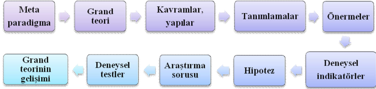
Şekil 1. Teori Test Etme Süreci (Moody, 1990).

teorinin kavramları, araştırma için yeniden açıklanır ve organize edilir. Üçüncü aşama ; bulgular sentezlenir, özgün teorinin gelişimi, yenilenmesi ya da modifiye edilmesinde kullanılır. Dördüncü aşamada ; araştırma sonuçlarından yeni bir teori geliştirilebilir (Parker, 2005). Ayrıca teorinin test edildiği araştırmalar için tanımlanan teori test etme süreci adımları Şekil 1’de gösterilmiştir (Moody, 2010).